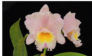
Rlc. Fragrant Yellow 'Baby Pink' BM/JGP 75p フレグラントイエロー 'ベビーピンク'