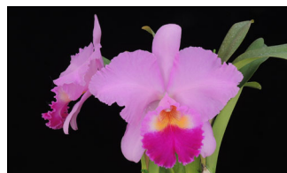
Rlc. Twenty First Century 'Generation Gap' SM/JGP 80p トゥエンティーファースト センチュリー 'ジェネレーションギャップ'