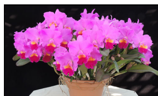
Rlc. Twenty First Century 'New Generation' BM/JGP 77p CCM/JGP 80p トゥエンティーファースト センチュリー 'ニュージェネレーション'