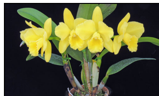
Rlc. Pure Vicky 'Nagoya' BM/JGP 76p ピュアビッキー '名古屋'