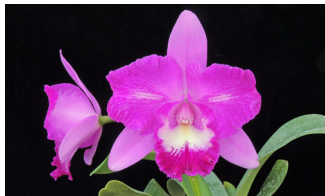
Lc. Pink Sparkle 'Sunrise Fuji' SBM 78p ピンクスパークル 'サンライズ富士'