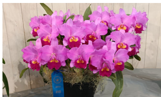
農林水産大臣賞・受賞 3月のJOGA洋らん展 にて受賞いたしました。 Rlc. Twenty First Century 'New Generation' トゥエンティーファースト センチュリー 'ニュージェネレーション'