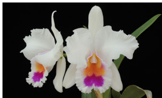
Rlc. Viva Copacabana 'Carnival' BM 75p ビバコパカパーナ 'カーニバル'